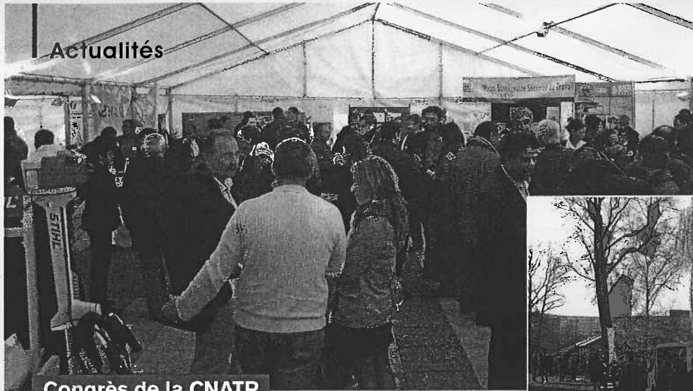
Congrès de la CNATP

Les congressistes étaient invités à se rendre sur les stands des vingt partenaires industriels pour s'informer et obtenir de la documentation sur les produits et services proposés.