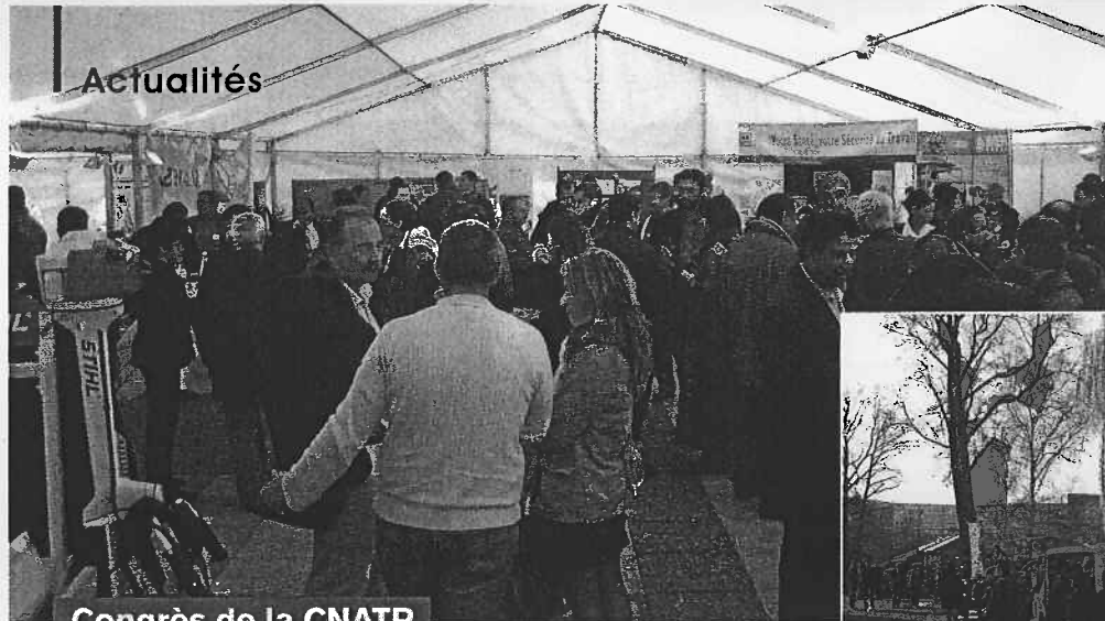
Congrès de la CNATP

Les congressistes étaient invités à se rendre sur les stands des vingt partenaires industriels pour s'informer et obtenir de la documentation sur les produits et services proposés.